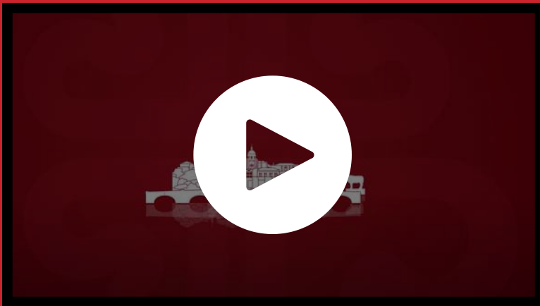
VÍDEO DE ACTIVIDADES "CAMINEMOS JUNTOS"