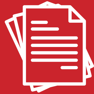
MANIFIESTO COMPLETO "CAMINEMOS JUNTOS"