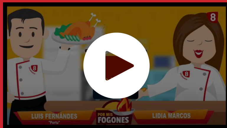
VÍDEO "POR MIS FOGONES"